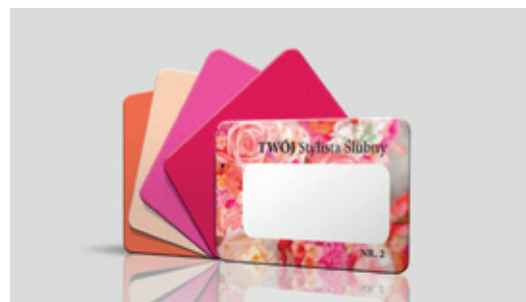
Wzornik ślubnych kolorów przewodnich (w formie poręcznego wachlarzyka)

Na karcie Wedding Color Planner wizażystka zaznacza kolor bieli ślubnej, który pasuje do odcienia skóry i włosów przyszłej Panny Młodej. Klientka otrzymuje również prezentację swoich ślubnych odcieni przewodnich, które zostały wybrane w drugim etapie usługi, czyli w wyniku analizy z użyciem ram kolorystycznych. Oprócz wizualizacji samych kolorów przewodnich na karcie znajdują się inspirujące zdjęcia demonstrujące jak praktycznie wykorzystać te barwy w stylizacjach ślubnych. Na ostatniej stronie karty Wedding Color Planner znajduje się tzw. face chart, na którym można wykonać projekt makijażu ślubnego oraz wypisać potrzebne kosmetyki.